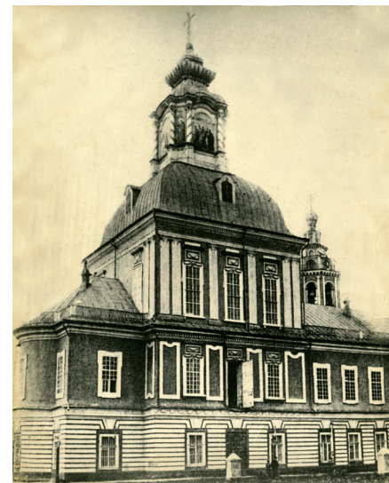
Церковь Николы Зарецкого (фото 1913)

Подобные описанному свободные от застройки участки при храмах — сходные с тем, который видим на плане [7] — интерпретировались в литературе чаще как городские площади, что как будто подтверждало тезис о том, что данный «проект... во многом предвосхитил принципы градостроительных работ XVIII в.» [28, с. 113]. На наш взгляд для такой их трактовки нет достаточных оснований. Применительно к Николо-Зарецкой церкви тот факт, что подобная «площадь» в 1740 здесь уже существовала, в то время, как перепланировка района только еще задумывалась, убедительно свидетельствует, что перед нами не новообразование, а фрагмент исконной, исторически сложив-