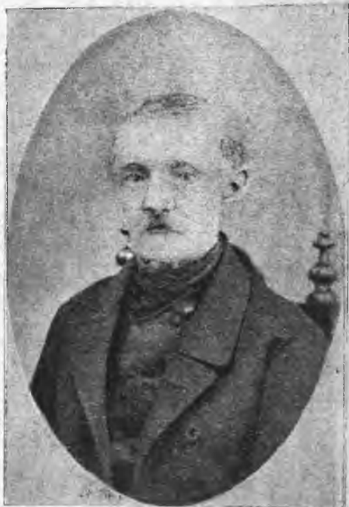
И. В. КИРЕЕВ в старости (с неизданной фотографии).

Осужден был по второму разряду и по конфирмации 10-го июля 1826 г. приговорен в каторжную работу на 20 лет. По случаю коронации Николая 1 срок сокращен до 15 лет. Наказание отбывал сначала в Свеаборге (с 21-го октября 1826 г.), а затем в Нерчинских рудниках, куда поступил 14-го апреля 1828 г. В 1832 г. срок наказания был сокращен до 10 лет. 14 декабря 1835 г. отбыл срок наказания и обращен на поселение. Местом жительства был назначен Минусинск, Енисейской губ. Здесь он жил вместе с декабристами А. П. и П. П. Беляевыми.