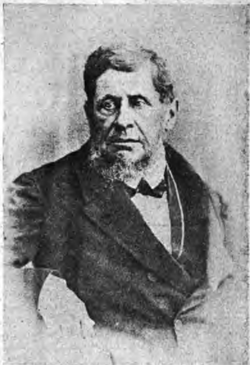
Н. И. ТУРГЕНЕВ (из кн. Головачева).