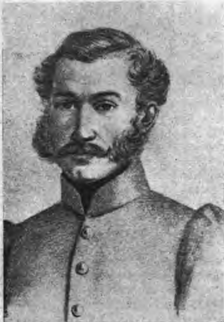
Вениамин Николаевич Соловьев.

править или снять кандалы. Последняя просьба не могла быть исполнена. Здесь он получил от Нарышкина 300 рублей. 12 февраля 1828 г. прибыл в Читу, а 16 марта прибыл в Нерчинский завод, а оттуда за 15 верст в горную контору на работу в глубокие рудники. На Зерентуйских рудниках он находился с своими товарищами Мозалевским и Сухиновым, задумавши там, при участии неких Голикова и Бочарова, поднять возмущение при участии партии в 200 человек. Сначала Соловьев и Мозалевский не подозревали этого намерения, но потом, догадавшись, перестали пускать к себе в дом заговорщиков, которые, тем не менее, решили заставить их силою участвовать. В ноябре 1828 г., учрежденной для суждения о сем бунте комиссией, Соловьев и Мозалевский были освобождены от обвинения, но, чтобы они не имели между собою сношения, было приказано разослать их в разные рудники на работы. Однако это не