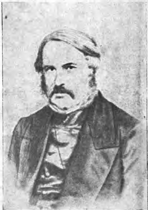
Павел Сергеевич Бобрищев-Пушкин.

Служил он по квартирмейстерской части при штабе 2-ой армии, стоявшей в Тульчине, где был центр Южного Общества. В Общество вступил он в 1822 г. и проявил себя, как член его, тем, что, по поручению Пестеля, написал, совместно с Заикиным, мнение о квартирмейстерской части, а также принял одного нового члена. Вместе с братом и братьями Заикиными он участвовал в сокрытии бумаг Пестеля, что было впоследствии поставлено ему в вину. После ареста он немедленно был доставлен вместе с братом в Петербург и 16 января 1826 г. заключен в Петропавловскую крепость. В собственноручной записке Николая I было сказано: «присылаемого Пушкина 2 посадить по усмотрению и содержать хорошо». Он был обвинен в умысле на царевубийство и сокрытии бумаг Пестеля. Осужден был по IV разряду и приговорен в каторжную работу на 12 лет, после которых