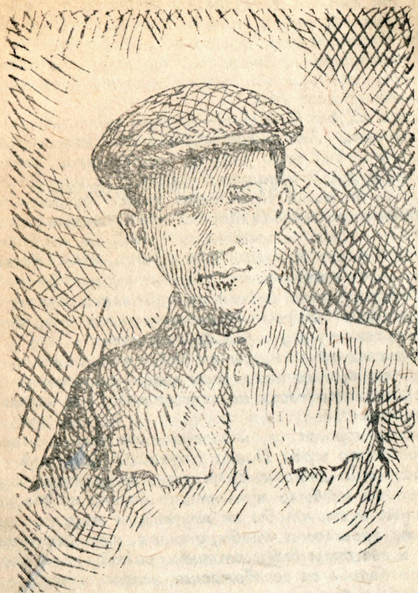
Герой Советского Союза комсомолец Александр Чекалин.